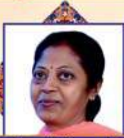
શ્રીમતી લતા ગિરીરા ધારશી ભેદા મોખા - ચાણા