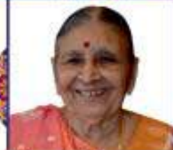
માતૃશ્રી પ્રભાવંતી વલ્લભજી ગાલા નાના આસંખિયા-માદુંગા